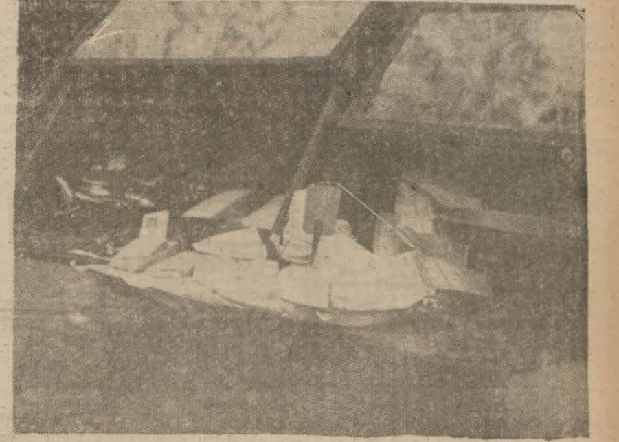
Dün kontrol eden peynireci dükkânlarından biri (Yazısını 2 nci sayfanın 3 ve 4 üncü sütunlarında bulacaksınız)

Zabita fiat mürakabe kontrol teşkilâtile beraber çalışmaya başladı, bu teşriki mesai müsbet neticeler veriyor